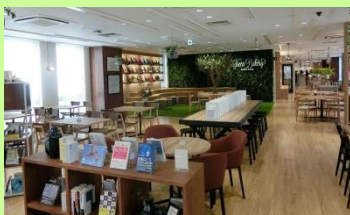
名城大学「Green Bakery BOOK CAFÉ」