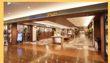
埼玉県桶川市「OKEGAWA honプラス+」