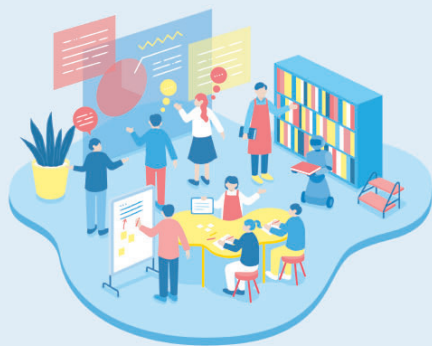
Community Planning & Management for Learners