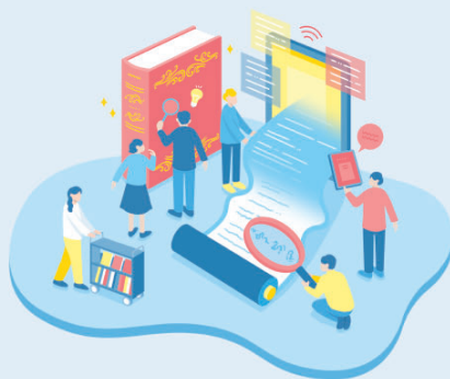
Academic & Educational Resources for Learners